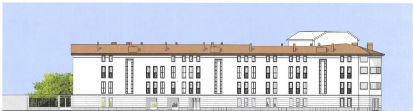
PROSPETTO NORD VIA BRESSAN