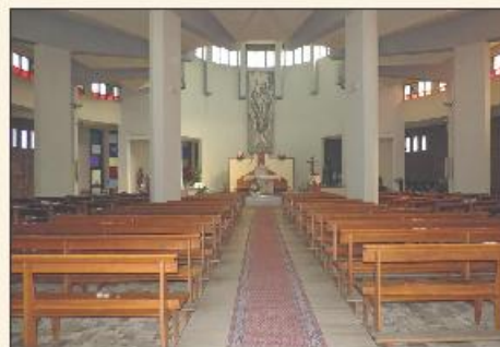
Chiesa Parrocchiale Cristo Re MILANO

(raggiungibile con la MM Rossa, fermata Villa San Giovanni, oppure con gli autobus 51, 81 e 87)