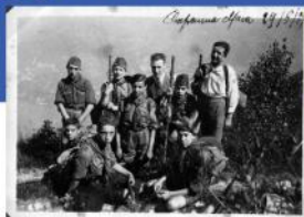
Le Aquile randagie alla Capanna Mara