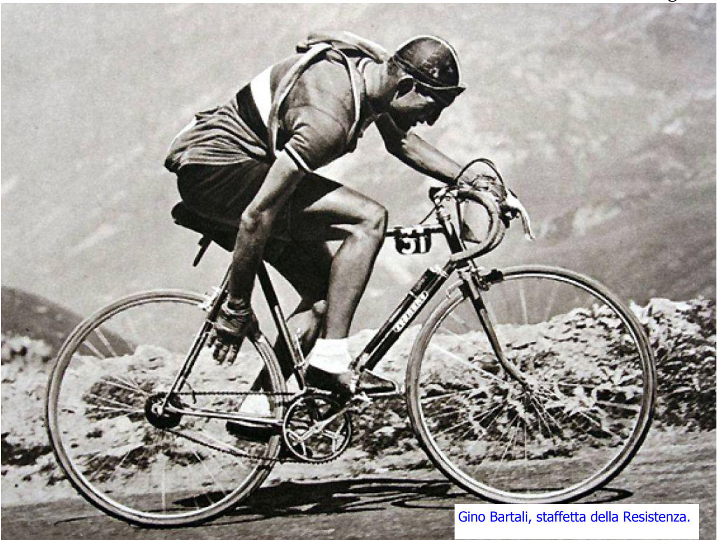
Gino Bartali, staffetta della Resistenza.