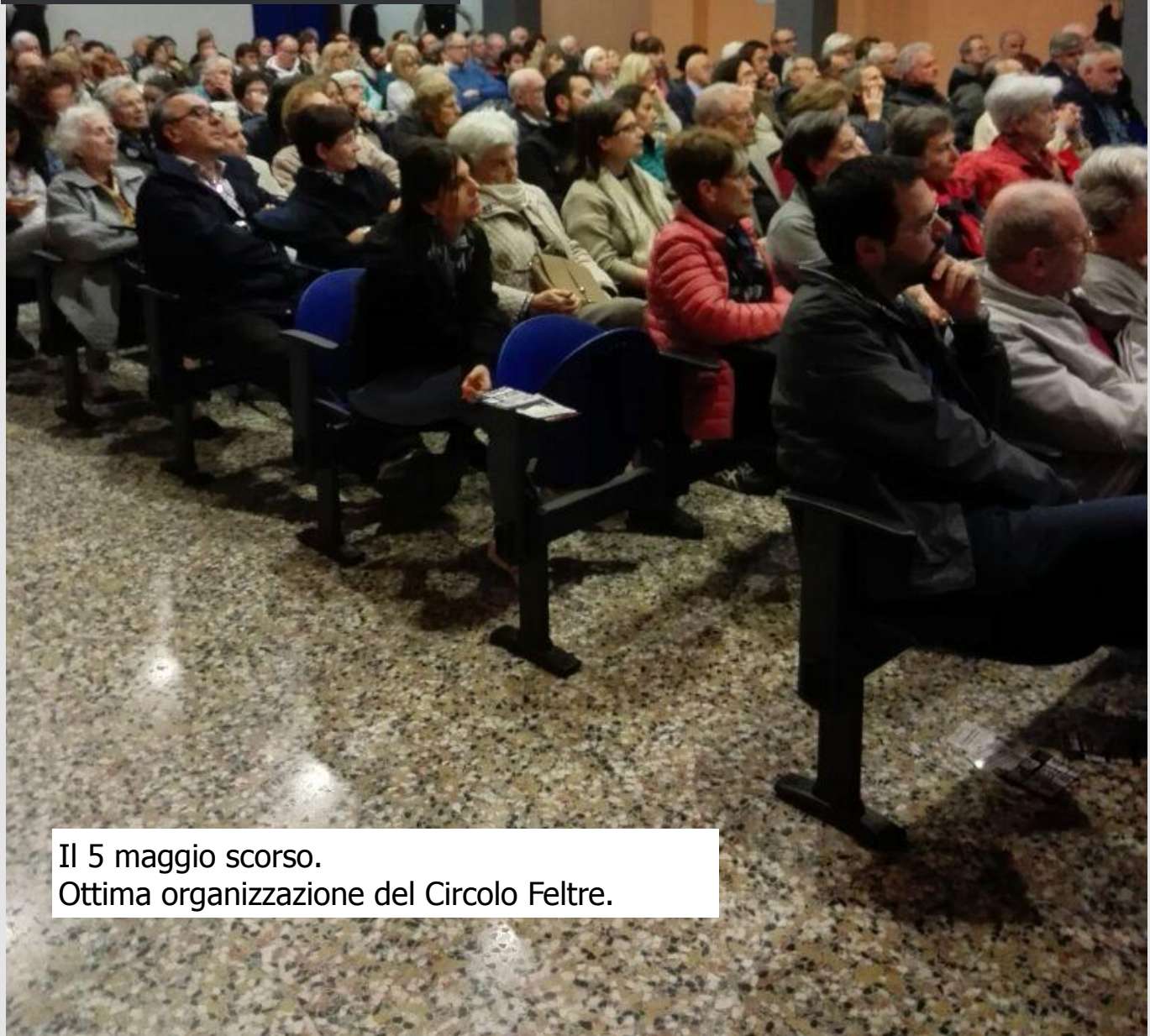
Il 5 maggio scorso. Ottima organizzazione del Circolo Feltre.