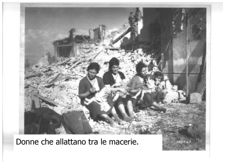
Donne che allattano tra le macerie.

Le Aquile Randagie, l'Oscar, il Ribelle, don Giovanni Barbare-schi (11 fotografie). Gli scout cattolici si oppongono alla egemonia educativa fascista, si sciolgono per continuare l'attività clandestinamente. Si riportano alcune fotografie e la testata di un giornale scout lombardo. Durante la guerra organizzano un'attività clandestina, denominata Oscar, di soccorso agli ebrei, sbandati, perseguitati politici che vengono ac-