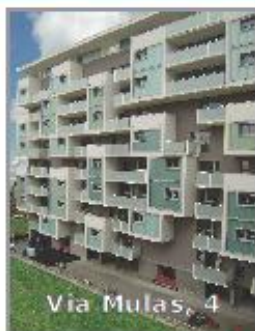
Via Mulas, 4