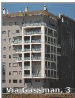
Via Gassman, 3