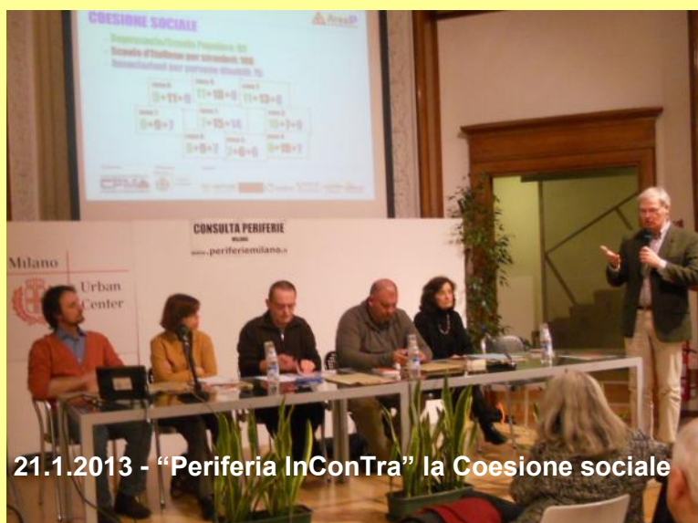
21.1.2013 - "Periferia InConTra" la Coesione sociale